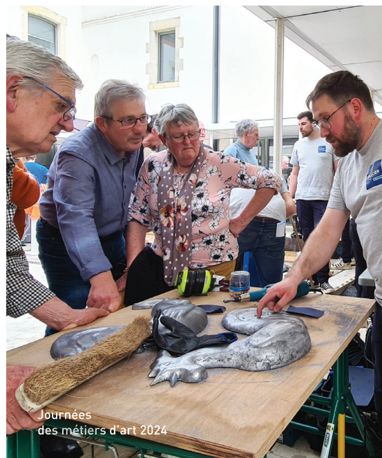
Journées des métiers d'art 2024