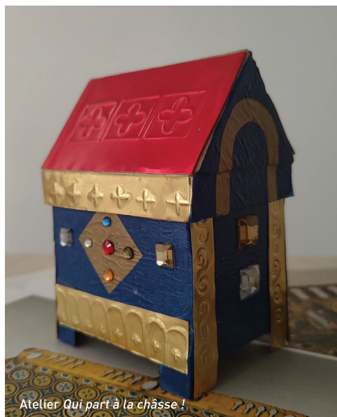
Atelier Qui part à la chasse !