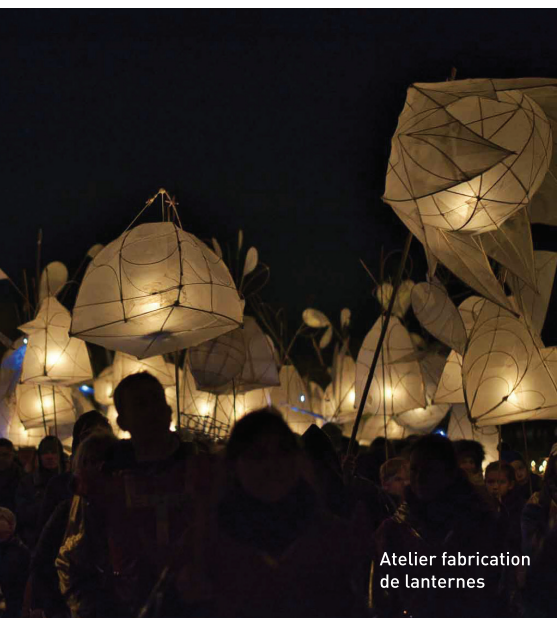
Atelier fabrication de lanternes

Tout public dès 6 ans (avec adulte) et 9 ans (en autonomie). Tarif : 5€ par lanterne avec 2 créneaux obligatoires.