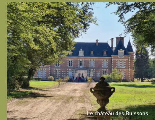
Le château des Buissons

Châteaux privés, patrimoine industriel, églises pittoresques, marine de Loire : en 2025, la 42 e édition vous permettra à nouveau de découvrir des sites exceptionnellement ouverts et animés par des passionnés.