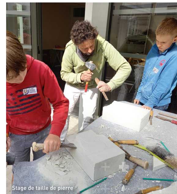
Stage de taille de pierre

Le stop motion est une technique qui consiste à animer des objets ou des personnages image par image. Les enfants réaliseront une séquence en stop motion autour des maquettes de l'abbaye. À partir de 7 ans. Tarif : 3€.