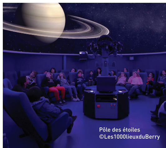
Pôle des étoiles